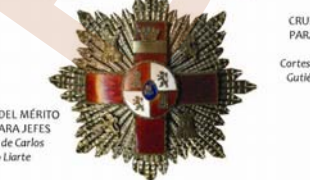
CRUZ ROJA DEL MÉRITO MILITAR PARA JEFEES. Colección de Carlos Lozano Llártze

La de suboficiales y oficiales era de la forma, tamaño, y cinta era de pasadores que a filete, pero de esmalte rojo con finete, rectángulo, corona, anilla, hebilla y pasadores de repetición de oro.