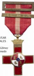
CRUZ ROJA DEL MÉRITO MILITAR PARA OFICIALES Y SUBOFICIALES PASADOR RUSIA.

La Gran Cruz lleva la placa de la misma forma y dimensiones que la de jefes, pero de oro las ráfagas. Además de una banda de cinta ancha, para llevar terciada del hombro derecho al lado izquierdo, terminando sus extremos en un lazo, del que pende la cruz esmaltada descrita para oficiales y suboficiales; el color es rojo, con una lista blanca en el centro, de anchura igual a la cuarta parte de la total de la banda.