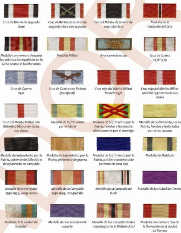
Cruz de Hierro de segunda clase Cruz al Mérito de Guerra de segunda clase con espadas Cruz al Mérito de Guerra de segunda clase Medalla de la Campaña del Este Medalla conmemorativa para los voluntarios españoles en la lucha contra el bolchevismo Medalla Militar Avance en la escuela Cruz de Guerra 1936-1939 Cruz de Guerra 1942 Cruz de Guerra con Palmas (no oficial) Cruz roja del Mérito Militar Modelo 1938 Cruz roja del Mérito Militar Modelo 1942 en todas sus clases Cruz de Sufrimiento por distintivo blanco en todas sus clases Medalla de Sufrimiento por la Patria Medalla de Sufrimiento por la Patria, heridos y lesionados directamente por el enemigo Medalla de Sufrimiento por la Patria, heridos y lesionados por otras causas Medalla de Sufrimiento por la Patria, pariente de fallecido o desaparecido en campaña Medalla de Sufrimiento por la Patria, prisionero de guerra Medalla de Sufrimiento por la Patria, prisión o asesinato de pariente en zona roja Medalla de Mutilado Medalla de la Campaña 1936-1939, vanguardia Medalla de la Campaña 1936-1939, retaguardia Medalla de la Campaña de Rusia Medalla de la ciudad de Gerona Medalla de la ciudad de Sabadell Medalla del excombatiente canario Medalla de los excombatientes manchegos de la División Azul Medalla conmemorativa de la liberación de la ciudad de Tarrasa